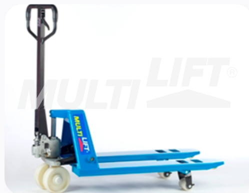
Largo de horquillas de solo 90.5 cm. Radio de giro muy compacto ¡Excelente para trabajo en espacios reducidos!