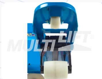
Rodillos de entrada y salida adicionales.