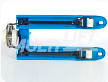
Construcción ultra reforzada.