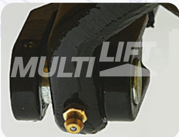
Graseras de lubricación en puntos clave.