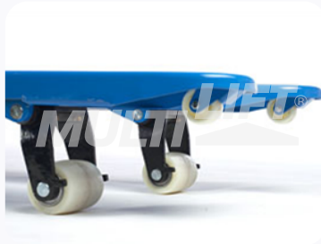
Ruedas de Nylamid tipo tándem.