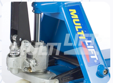
Bomba hidráulica de una sola pieza, que maximiza eficiencia y productividad.