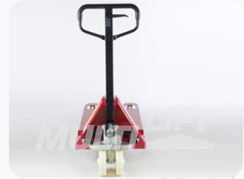
Maneral de operación con manija de 3 posiciones.