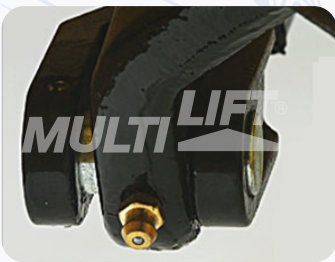
Graseras de lubricación en puntos clave.