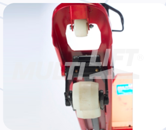
Rodillos de entrada y salida adicionales.