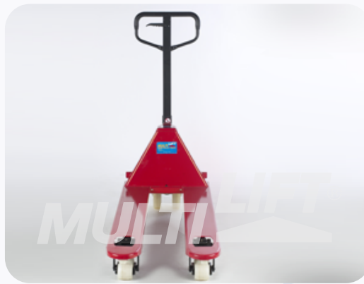
Ancho de Horquillas adecuado para manejo de tarimas angostas o europeas.