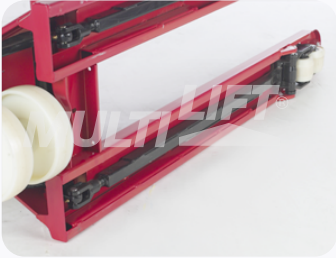
Construcción ultra reforzada.