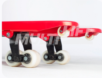
Ruedas de Nylamid tipo tándem.