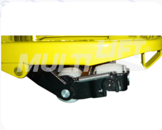
Gracias a su rueda auxiliar delantera, cuando el patín se levanta puede trabajar en un ángulo de 90°.