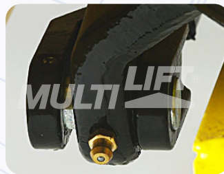
Graseras de lubricación en puntos clave.