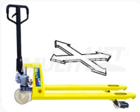
Diseñado para mover mercancía en lugares muy estrechos y confinados donde no se puede dar vuelta.