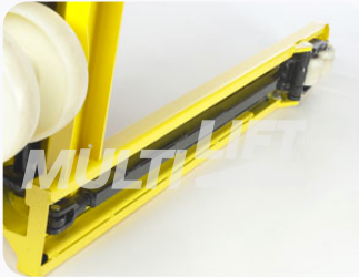
Construcción ultra reforzada.