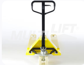
Maneral de operación con manija de 3 posiciones.