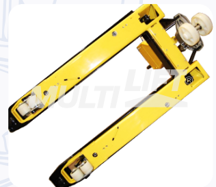
Construcción ultra reforzada.