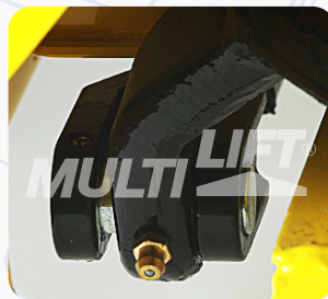
Graseras de lubricación en puntos clave.