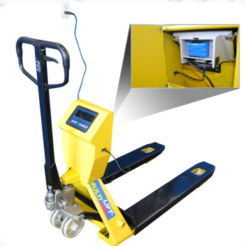
Puede trabajar con energía interna (baterías recargables) o externa (110 v).