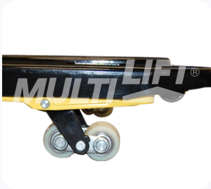
Ruedas de Nylamid tipo tándem.