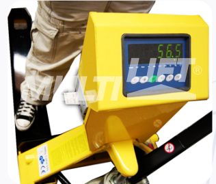
La báscula puede ser leída desde diferentes ángulos.