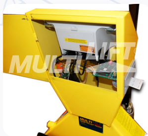
Puede trabajar con energía interna (baterías recargables) o externa (110 v). La impresora opcional se alimenta con cualquiera de ellas.