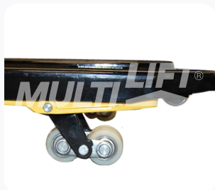
Ruedas de Nylamid tipo tándem.