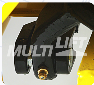
Graseras de lubricación en puntos clave.