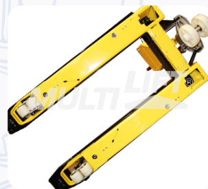
Construcción ultra reforzada.