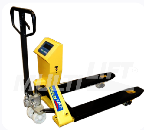
Permite transportar y pesar la carga al mismo tiempo.