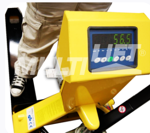
La báscula puede ser leída desde diferentes ángulos.